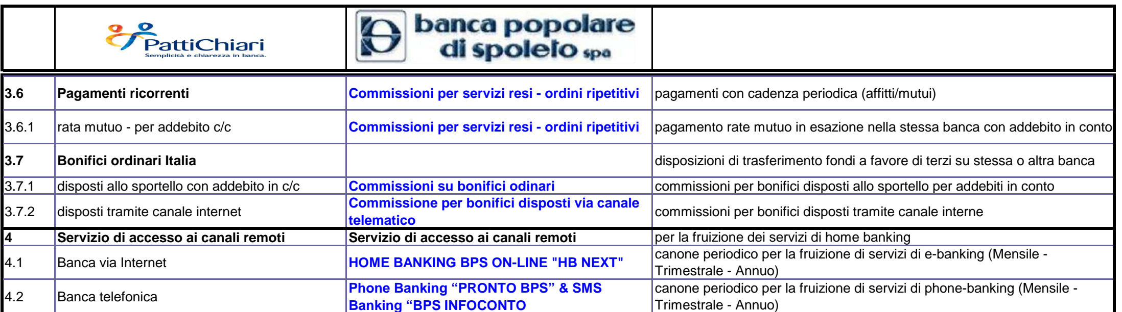
TABELLA DI RACCORDO TRA LE VOCI DELLA "SCHEDA STANDARD" PATTICHIARI e LE VOCI ADOTTATE DALLA BANCA